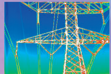
Transporte y distribución eléctrica