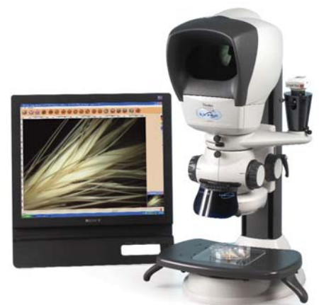
Lynx en versión de columna con cámara para captura de imágenes y mesa flotante (accesorios opcionales)