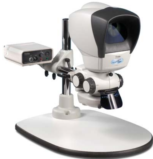
El microscopio Lynx proporciona flexibilidad y facilidad de uso gracias a su gran plataforma y el brazo regulable.