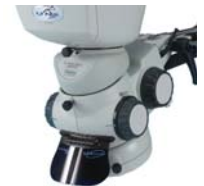
Visor de ángulo fijo