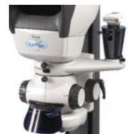
Captura y archivo de imágenes