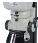
Multiplicador de aumento por pasos