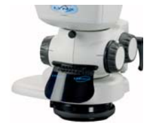
Visor oblicuo y directo